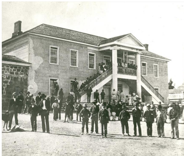
School Days at Colton Hall, 1884